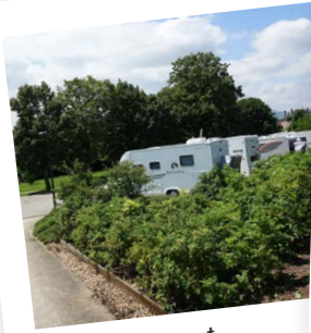
Aire de stationnement