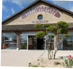
Caveau Vignerons des Terres Secrètes